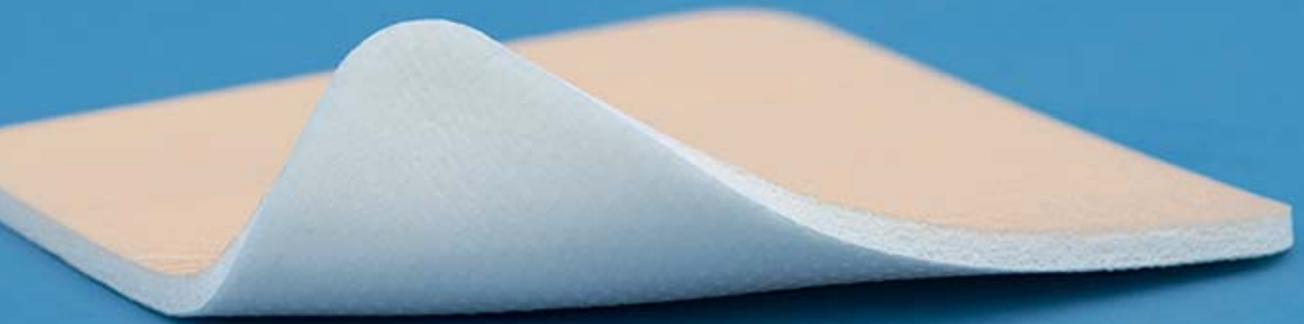
Wundauflage mit Rand