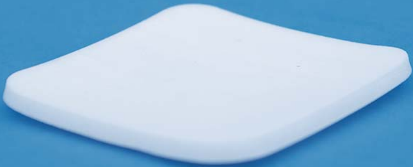
Wundauflage mit Rand